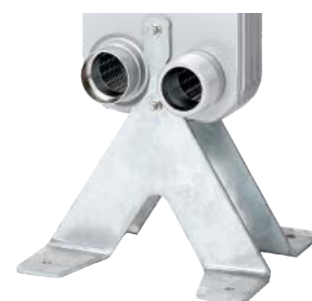
Опоры и монтажные кронштейны